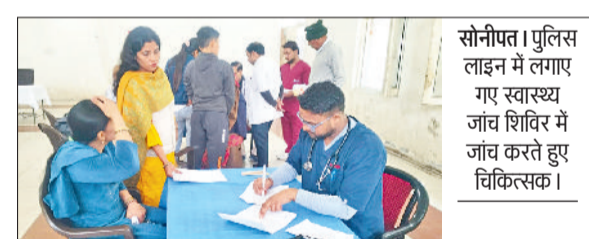
सोनीपत। पुलिस लाइन में लगाए गए स्वास्थ्य जांच शिविर में जांच करते हुए चिकित्सक।

पुलिस लाइन सोनीपत में निशुल्क स्वास्थ्य जांच शिविर आयोजित किया, जिसमें मैमोरियल हॉस्पिटल सोनीपत के चिकित्सकों ने सेवाएं प्रदान कीं। शिविर में 117 से अधिक पुलिसकर्मियों, उनके परिजनों व डीएवी स्कूल के छात्र-छात्राओं का आधुनिक उपकरणों से विस्तृत स्वास्थ्य परीक्षण किया गया। जांचों में बोन मिनरल डेंसिटी, हीमोग्लोबिन, ईसीजी, शुगर, ब्लड प्रेशर, दंत, नेत्र तथा अन्य लेब जांचें