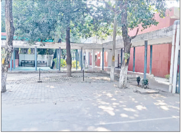
सोनीपत। वर्क सस्पेंड के चलते सुनसान दिखाई देते अदालत परिसर।