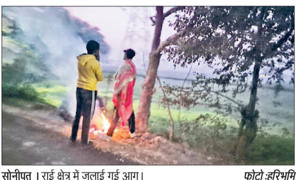
सोनीपत। राई क्षेत्र में जलाई गई आग।

सर्दी के मौसम में बदलाव का दौर जारी है। पिछले चौबीस घंटों में अधिकतम और न्यूनतम तापमान दोनों में वृद्धि दर्ज की गई है, जिससे सोनीपत के निवासियों को कंपकंपाती ठंड से थोड़ी राहत मिली है। शुक्रवार को शहर का अधिकतम तापमान 22.6 डिग्री सेल्सियस दर्ज किया गया, जो एक दिन पहले 22.1 डिग्री सेल्सियस था। इसी प्रकार, न्यूनतम तापमान भी 4.1 डिग्री सेल्सियस से बढ़कर 5.2 डिग्री