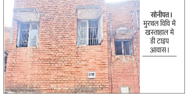
सोनीपत। मुरथल विवि में खस्ताहाल में डी टाइप आवास।