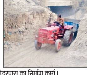
गन्नीौर। अधर में रुका अगवानपुर रेलवे अंडरपास का निर्माण कार्य।

कटाई को लेकर है। रेलवे विभाग ने बिना अनुमति पेड़ काटे थे, जिस पर वन विभाग पहले ही जुर्माना लगा चुका है। इसके बाद से रेलवे विभाग पेड़ों की कटाई के लिए एनओसी लेने की तैयार नहीं है। रेलवे अधिकारियों का कहना है कि अंडरपास के कुछ हिस्सा पीडब्ल्यूडी की सीमा में आता है और