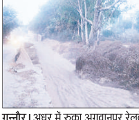
गन्नीौर। अधर में रुका अगवानपुर रेलवे अंडरपास का निर्माण कार्य।