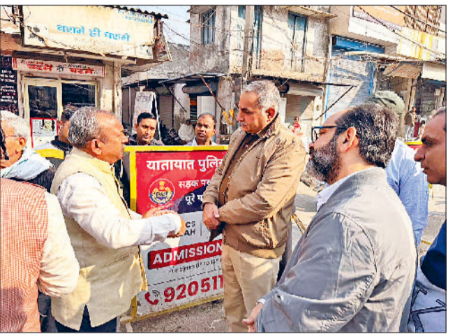
सोनीपत। ट्रैफिक व्यवस्था का जायजा लेने के दौरान व्यापारियों के साथ पुलिस अधिकारी।

बन जाती है दुर्घटना की स्थिति गौरतलब है कि शहर के मुख्य चौकों और मार्गों पर दुकानों के बाहर रखे सामान और सड़क पर लगाई गई रेहड़ियों के कारण अक्सर ट्रैफिक जाम और दुर्घटना की स्थिति बन जाती है। इस अभियान के दौरान ककरोई चौक के पास कुछ दुकानदारों द्वारा रेहड़ियों से किराया वसूली किए जाने की भी जानकारी मिली है, जिस पर अब पुलिस द्वारा कड़ी निगरानी रखी जा रही है। मविध्य में भी जारी रहेगा अभियान: कादयान पुलिस उपायुक्त ट्रैफिक नरेंद्र कादयान ने स्पष्ट किया कि यातायात व्यवस्था को बेहतर बनाए रखने के लिए इस तरह के अभियान नियमित रूप से जारी रहेंगे। उन्होंने चेतावनी दी कि ट्रैफिक नियमों का उल्लंघन करने, सड़क किनारे वाहन खड़ा करने, अवैध अतिक्रमण करने और निर्धारित स्थानों से बाहर ओटो खड़ा करने वाले लोगों को विरुद्ध सख्त कानूनी कार्रवाई की जाएगी।