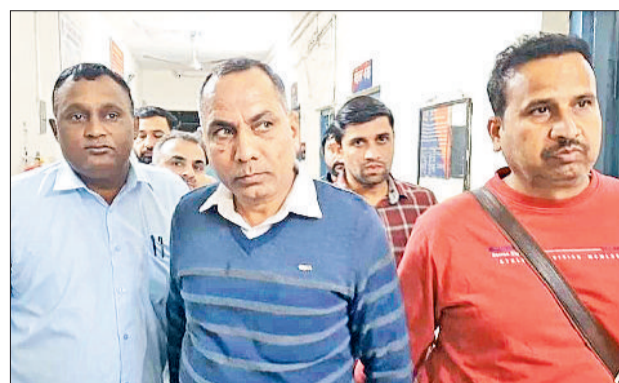
सोनीपत। विजिलेंस की टीम की गिरफ्तार में आरोपी दरोगा।

दर्ज किया गया था। इस मामले में दोनों पक्षों के बीच पहले ही समझौता हो चुका था, लेकिन उसके बावजूद कार्रवाई का भय दिखाते हुए थाना