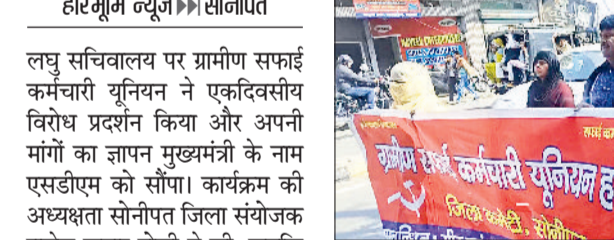
सोनीपत। विरोध प्रदर्शन करते हुए सफाई कर्मचारी।

ग्रामीण सफाई कर्मचारी यूनियन ने उठाई स्थयी भर्ती और वेतन बढ़ोतरी की मांग