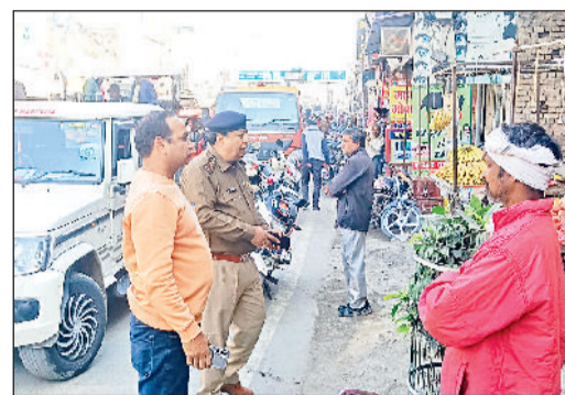
सोनीपत। अवैध अतिक्रमण के खिलाफ कार्रवाई करते हुए पुलिस और निगम की टीम।